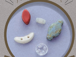
マルチホールビーズ