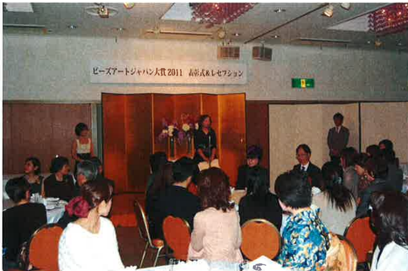
過去のレセプションパーティーの様子

広島にはビーズ工場が多数あり、「シードビーズ」の聖地と言われています。日本のシードビーズはクオリティーが高いと世界より評価されております。「シートビーズ」の聖地・広島でのレセプションパーティーをお楽しみください。パーティー当日は、ファッションデザイナーの桂由美さんや、シートビーズの生産地であるインドより、インド大使も出席します。日本中からビーズ愛好家が集まるこのレセプションパーティーに、ご自身が作られたアクセサリーを身につけ、お洒落も楽しんで是非ご参加下さい。