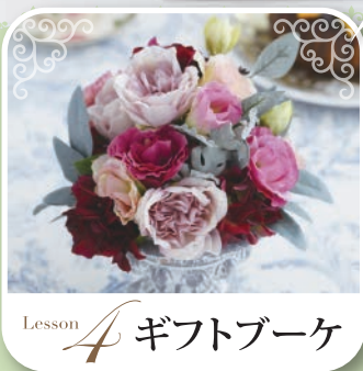
Lesson 4 ギフトブーケ