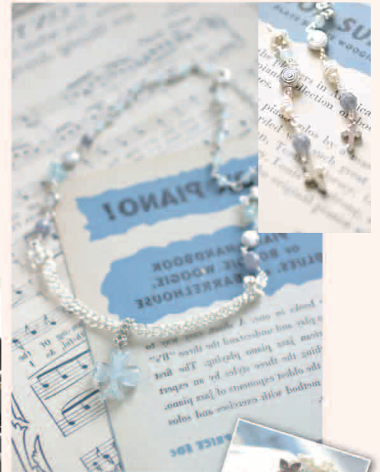
▲ヴェネチアnkrossのチョーカー ◎ Wire weaving