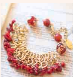
▲Lace Mailのブレスレット (赤珊瑚) ◎ チェインメイル