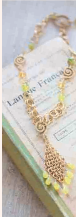
▶Diamond Chainの ネックレス(グリーン) ◎ チェインメイル