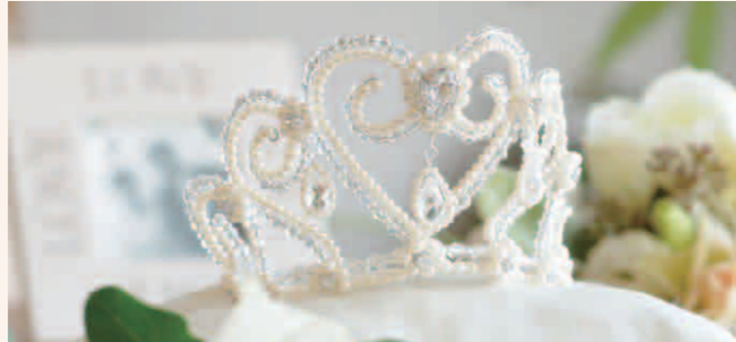
▲Style12 スワロフスキーとパールのティアラ ◎ 立体