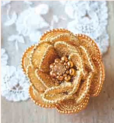
▲Style9 カメラのコサージュ ◎ クロスターアルパイテン