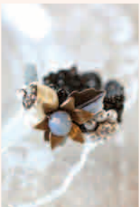
▼Petit Style11 アンティークスタイル のリング ◎ ルーミング