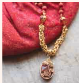
▲Byzantine Chainの ネックレス(縞メノウ) ◎ チェインメイル