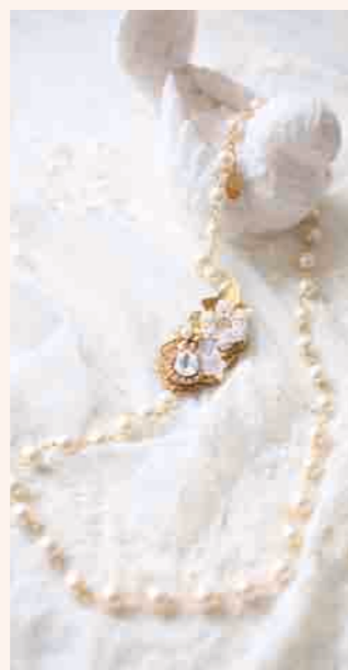
▲セレブレーションネックレス ◎ タベストリー