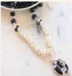
▼Byzantine Chainの ネックレス(赤メノウ) ◎ チェインメイル