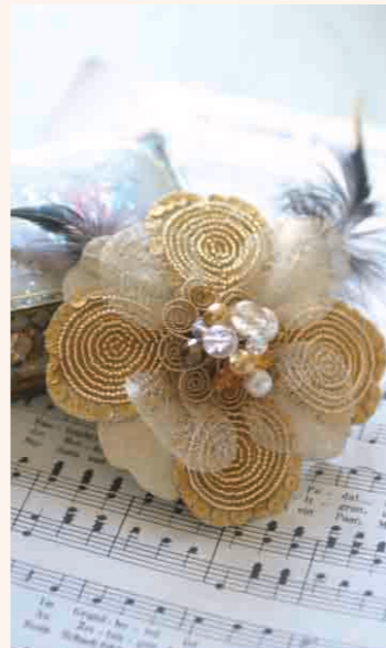
▶Magnoliaのコサージュ (ゴールド) ◎ ワイヤ刺繍×メタリックリボン使い