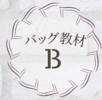
Lesson 1 トートバッグ