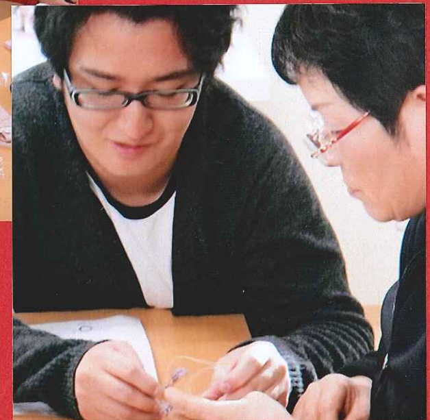
完成までゆっくりと丁寧に おしえて 下さいました。