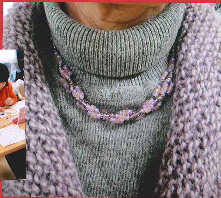
ご自身で編まれたベストに 「色がぴったり」と、とても喜んでいただきました。