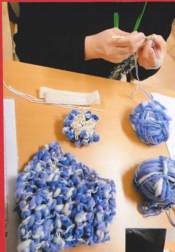
会津は とても寒いところなので マフラーに参加が集中すると思 っていましたが、 3人でした クワシエカフエのレッスン1の ジュジュも作ってみました おそろいで使えます♡