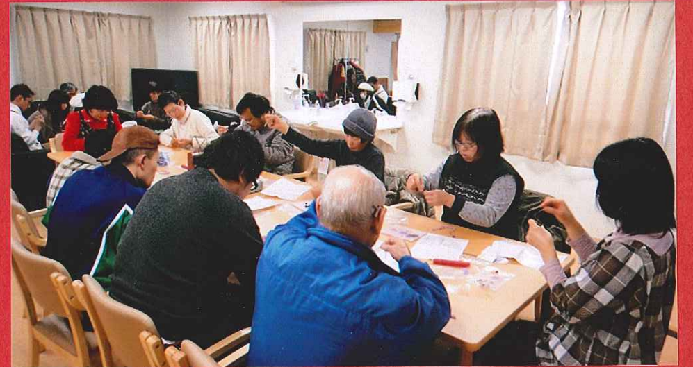
↑ 午前中に参加して下さった男性(若者)とおじいちゃん