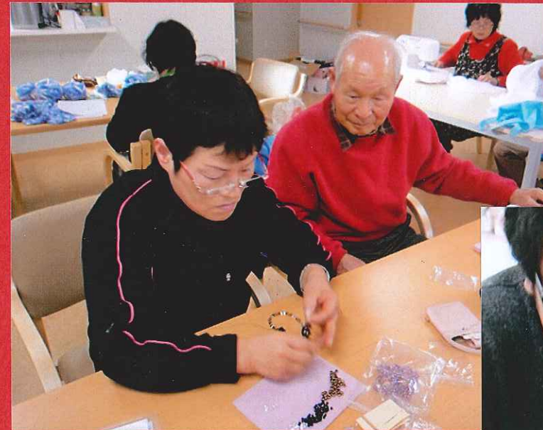
午後は先生となって 参加です。 ありがとうございました。