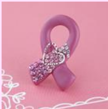
ピンクリボンのタックピン ～ロージークリスタルリボン～ 講習費：1,944円

「ビーズフェスティバル」内でも参加することができます。タックピンは渡辺由美子先生がデザインし、先生が直接指導します。