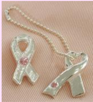
アートクレイシルバーバッグチャーム ※2種類から選べます。 講習費：2,500円