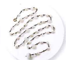
3時30分～ 加山忠則 カノン ～チェーンノットの天然石ネックレス～ 参加費:14,040円 (定員25名さま)