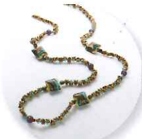
11時～ 宮本邦子 splendore プリマヴェーラネックレス 参加費:9,504円 (定員25名さま)