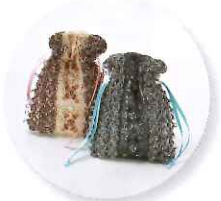
3時30分～ 岡本恵子 かぎ針で編むジュエリーブローチ 参加費:5,616円 (定員16名さま) ※細編みが編める方向け