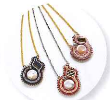
1時～ 周藤紀美恵 ソウタシエで作る ビスケットネックレス 参加費:3,780円 (定員30名さま) ※色をお選びいただけます。