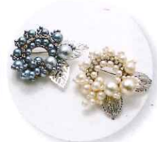
3時30分～ 岸美砂子 鎖編みだけで作る ～サークルパールブローチ～ 参加費:5,940円 (定員25名さま) ※色をお選びいただけます。