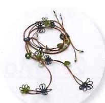
1時～ 山中恵+aYa タティングモチーフのラリエット 参加費:7,020円 (定員15名さま) ※タティング初心者向け