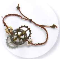
1時～ 瞳硝子 歯車の左右結びブレスレット 参加費:2,916円 (定員30名さま)