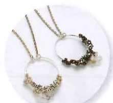
1時～ 清水ヨウコ シングル結びの ソリッドモチーフネックレス 参加費:12,636円 (定員25名さま) ※色をお選びいただけます。