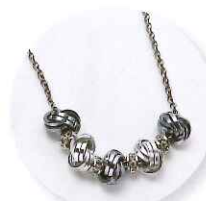
11時～ ゲネス多絵 チェインメイル ダブルスパイラルの ノットネックレス 参加費:5,400円 (定員30名さま)