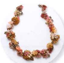
3時30分～ 山中恵+aYa タティングネックレス花つなぎ 参加費:12,960円 (定員15名さま) ※タティングが編める方向け