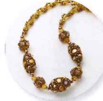
11時～ 青木恵理 Lead繋がるネックレス 参加費:5,400円 (定員15名さま)