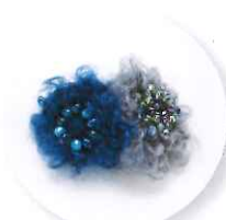
3時30分～ 日柳佐貴子 モヘアフワーブローチ 参加費:4,968円 (定員30名さま)