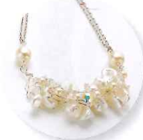
1時～ 閑けい子 リリアン編みで作るネックレス～F～ 参加費:4,320円 (定員30名さま)