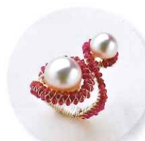
11時～ ジェニユイン/勝亦遠 ルビー&真珠フリーサイズRing ワイヤーラッピング 参加費:16,200円 (定員30名さま)