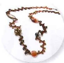
11時～ ナガツボジュンコ レッドパーティーネックレス 参加費:5,400円 (定員15名さま)