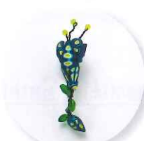
11時～ ケリー真美 Blue Budsブローチ 参加費:5,400円 (定員15名さま)