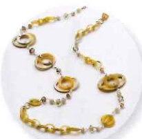
1時～ ウタ・オーノ 空五倍子utsubushi色の モノグラムネックレス 参加費:15,120円 (定員20名さま)