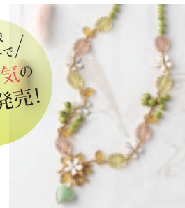
White Flower (ネックレス・ブレスレット・イヤリングの3点セット) キット12,500円、完成品25,000円