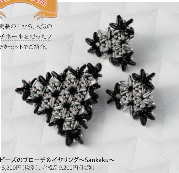
三角ビーズのブローチ&イヤリング~Sankaku~ キット5,200円(税別)、完成品9,200円(税別)