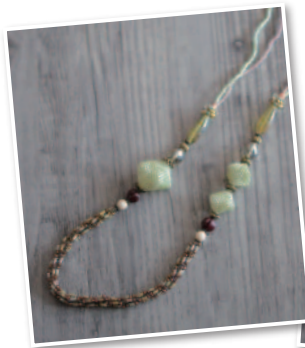
ふうせんかざら キット3,900円