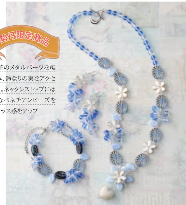
White Flower ~Blueバージョン~ (3点セット) キット12,500円、完成品25,000円

白い花のメタルパーツを編みこみ、鈴なりの実をアクセントに。ネックレストップには上質なベネチアンビーズを飾りクラス感をアップ