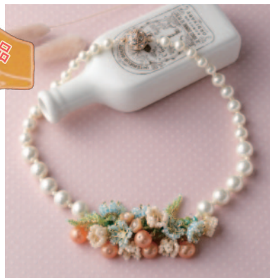
プリマベラ キット4,300円