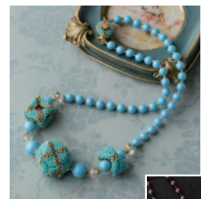
ペヨーテステッチで編む ネックレス キューブアラカルト キット5,900円

マルチホールで作る ビーズボールの ネックレス ~ピーニャ~ (レッド・ホワイト) キット4,300円