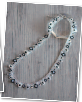
蓮花(モノトーン) キット3,600円