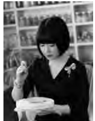
カリキュラム考案者 兼レッスン作品デザイナー