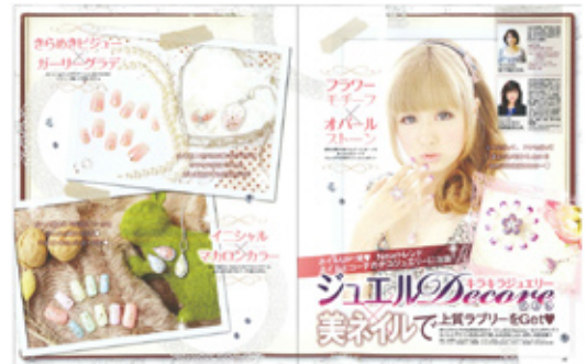
表紙に「ジュエルDeCoRe」(左：9月23日発売号のネイル専門雑誌『ネイルUP』が紹介されています。(ブティック社刊)表紙、上：恒岡先生が取り上げられたコーナー)