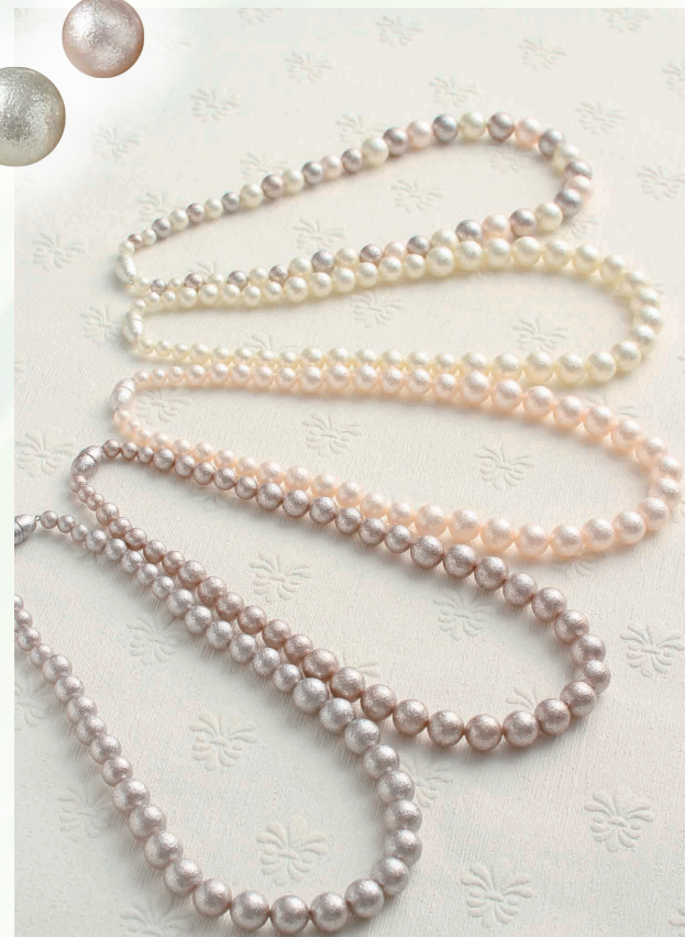
グラデーションネックレス 各1,944円 (※マルチカラーのみ 2,160円)

初心者の方にも作りやすいレシピをお値打ち価格が大好評! 夏の体験会の教材としてもぴったりです!