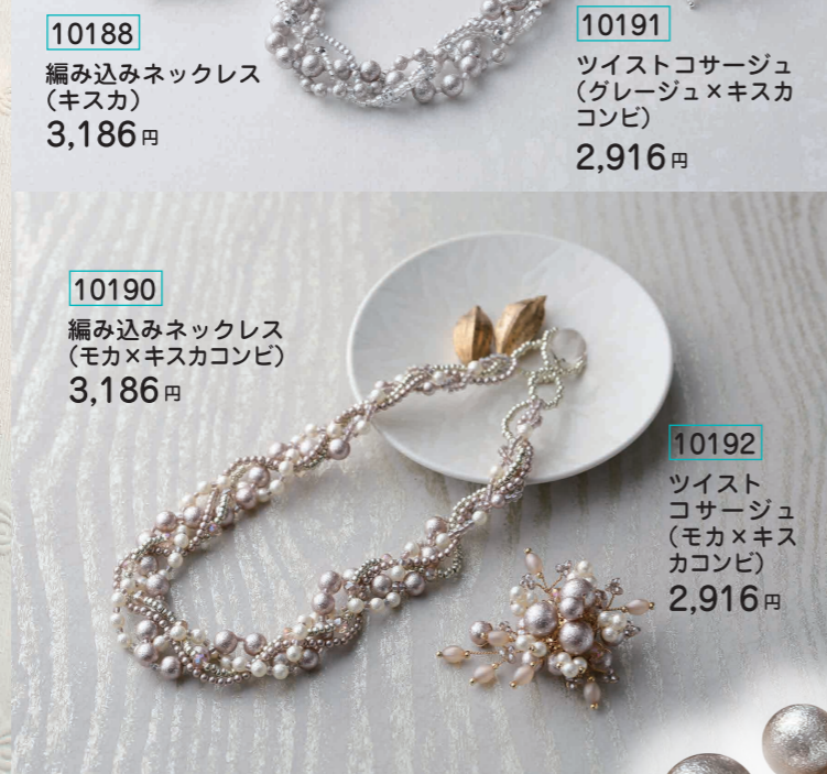
10190 編み込みネックレス (モカ×キスカコンビ) 3,186円