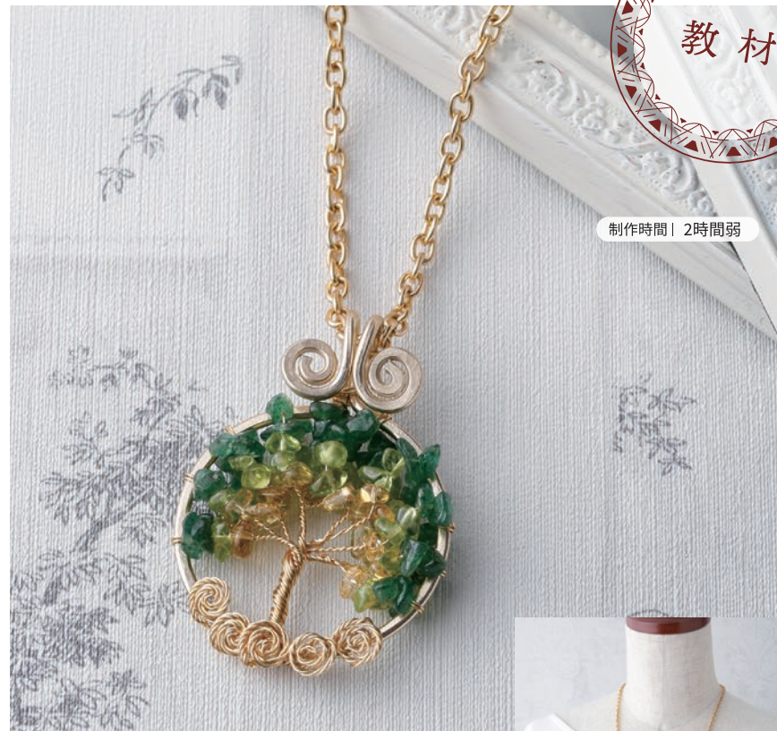
制作時間 | 2時間弱