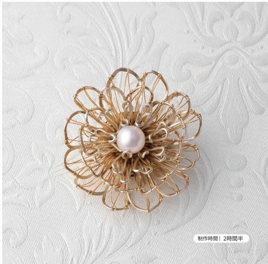
制作時間 | 2時間半