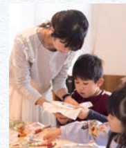
(デザイン) Cotoha コトハ

アパレルメーカー企画職後、ロンドンでのデザイン留学等を経て、フランスのオートクチュール刺しゅう技法“リュネビル”を修得。2014年、娘の1歳の誕生日に刺繍アトリエ“Cotoha”として始動。オーダー制作とワークショップを中心に活動。