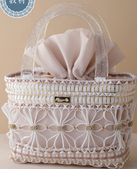
〔仕上がりサイズ〕 約縦16×横21×幅8cm