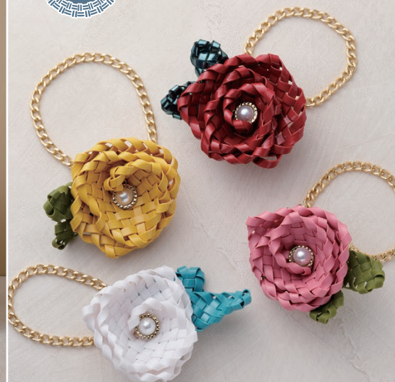
〔仕上がりサイズ〕 約縦7×横8×厚み3.5cm ストラップの長さ23cm