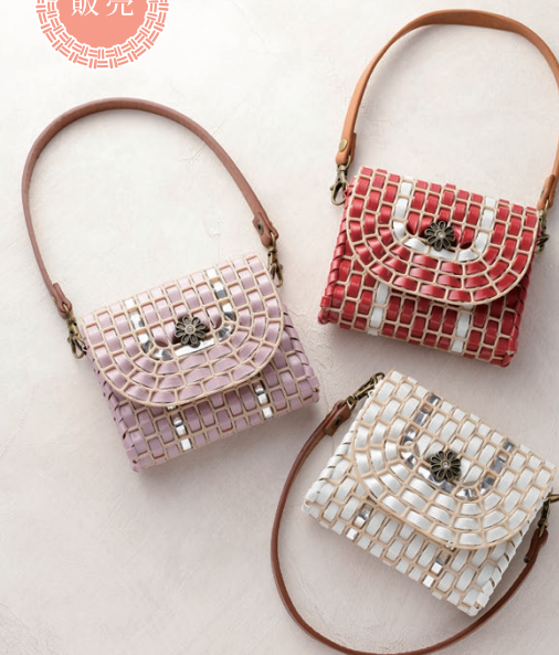
〔仕上がりサイズ〕 約縦8.5×横10×マチ3cm 持ち手の長さ35cm