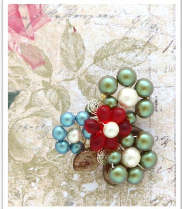
デザイン 大桃 ちとせ